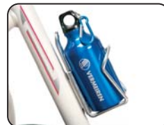
E7 - Porta borraccia (borraccia non inclusa)