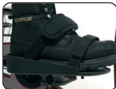
F3 - Appoggio piede con chiusura a velcro