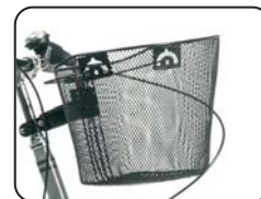
E14 - Cestino metallico anteriore