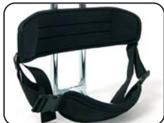
P2 - Supporto schiena