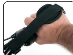
E9 - Cintura blocco mani