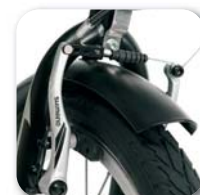
Sistema freni a V