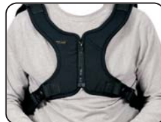
U73 - Cintura a gilet Neoflex