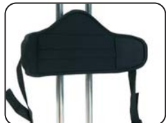
P1 - Supporto pelvico