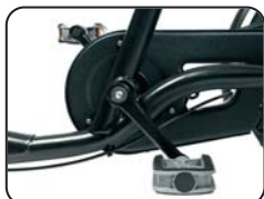
O1 - Pignone libero