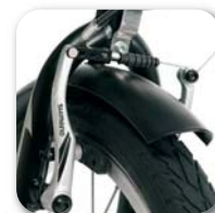
Sistema freni a V