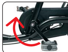
O2 - Freno a pedale