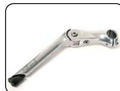
S5 - Staffa di sterzo regolabile