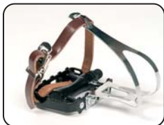
F2 - Pedali con cinghie a clip