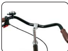
S3 - Manubrio tipo Citybike