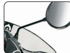
E8 - Specchietto retrovisore