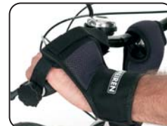
E10 - Cintura blocco mani