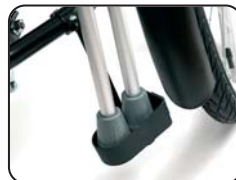
E6 - Porta stampelle