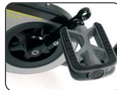
F5 - Pedali con lunghezza regolabile in 2 posizioni