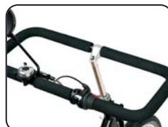
S4 - Manubrio rettangolare