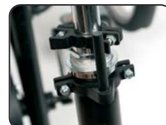
D1 - Blocco rotazione a 360°