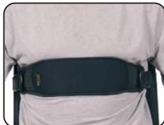
U80 - Fascia toracica Neoflex