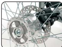
B1 - Freno a tamburo inserito nell'asse della ruota anteriore