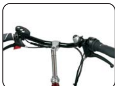
S2 - Manubrio ad V piatto