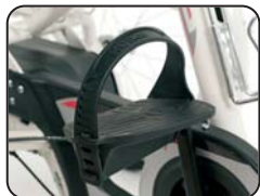
F1 - Pedali con cinghie