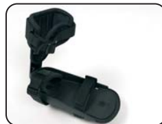
F4 - Appoggio piede con chiusura a velcro e supporto caviglia