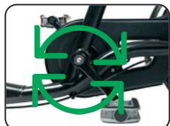
O6 - Pignone fisso