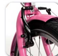
Sistema freni a V

Per opzioni e configurazioni disponibili vedere pag. 22