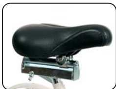
P4 - Sella regolabile in profondità