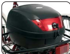
E5 - Bauletto