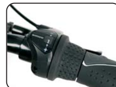
O7 - Cambio a 7 rapporti