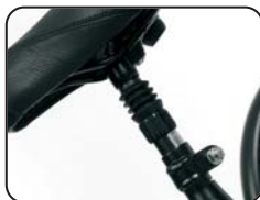
P5 - Tubo sella con ammortizzatore