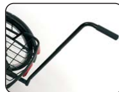
E1 - Maniglia di spinta