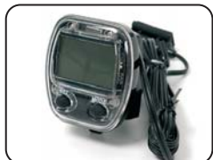
E3 - Contachilometri