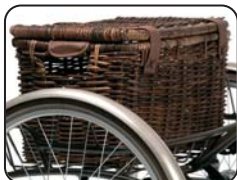
E4 - Cestino solo per modello Vintage