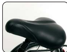
E12 - Sella comfort