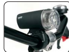
E2 - Kit luci anteriore posteriore