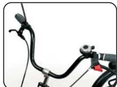
S1 - Manubrio ad U classico