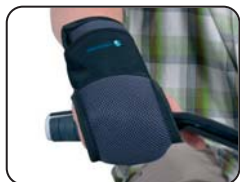
E11 - Guanto blocco mani